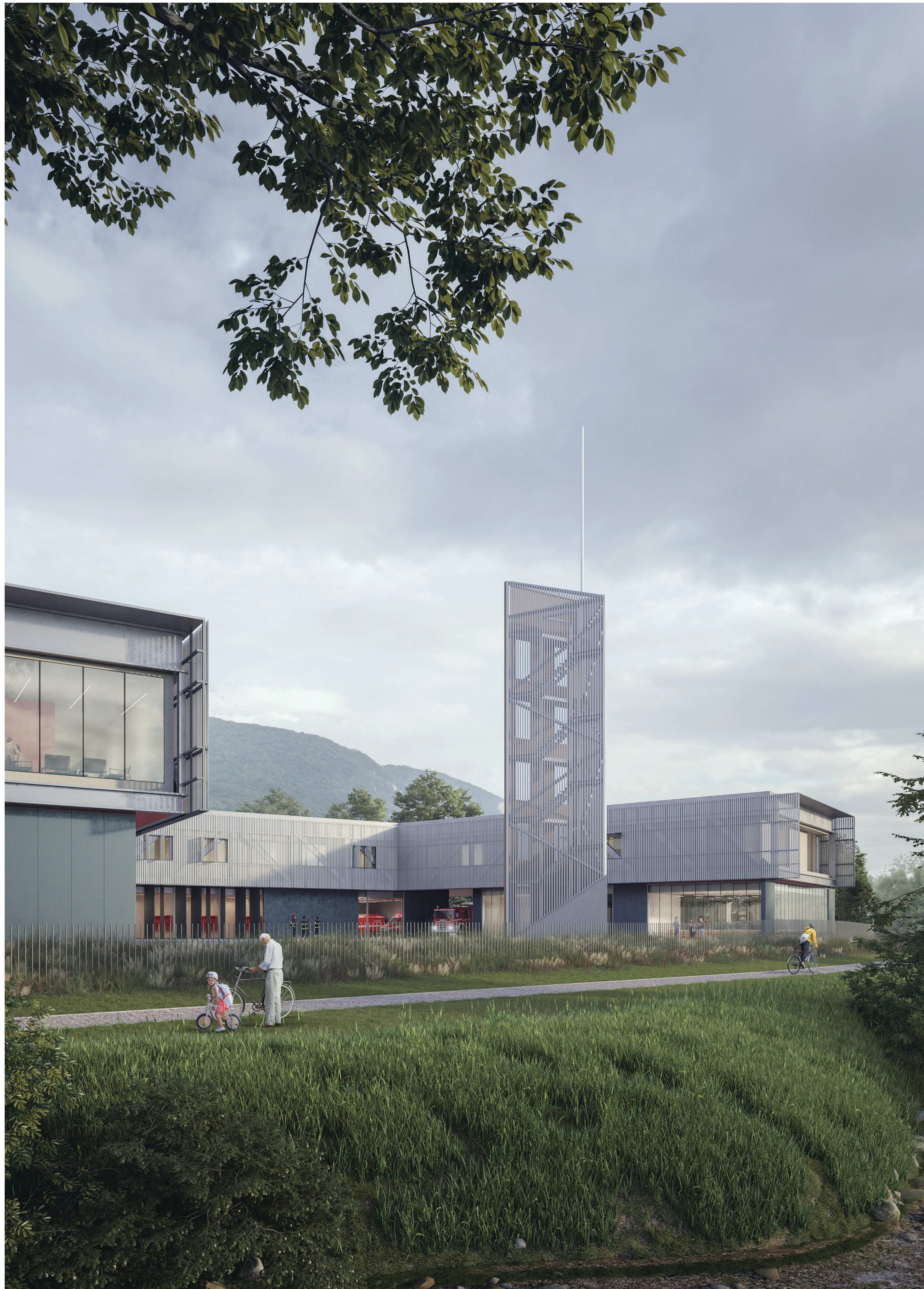
Vista dal percorso ciclipedonale