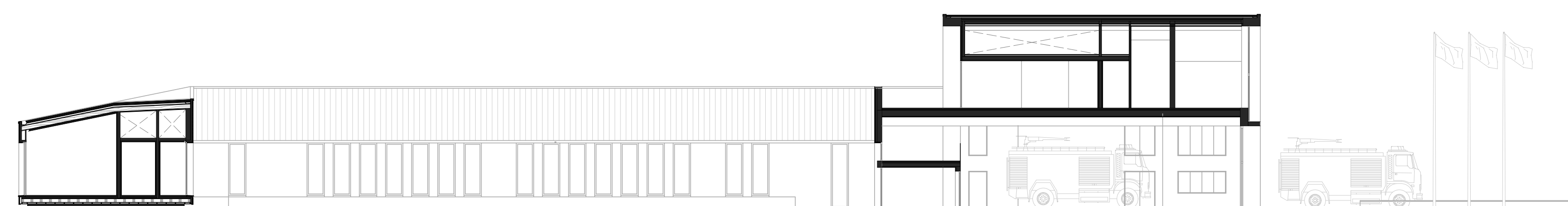
SEZIONE CC Rapporto con il lungolago