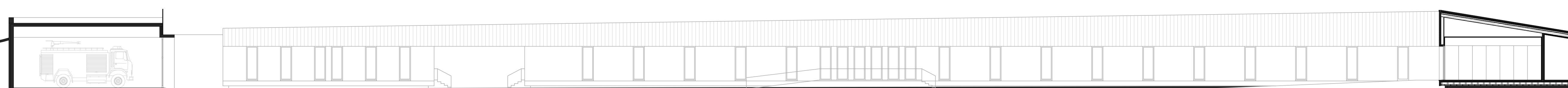
SEZIONE DD vista dalla corte