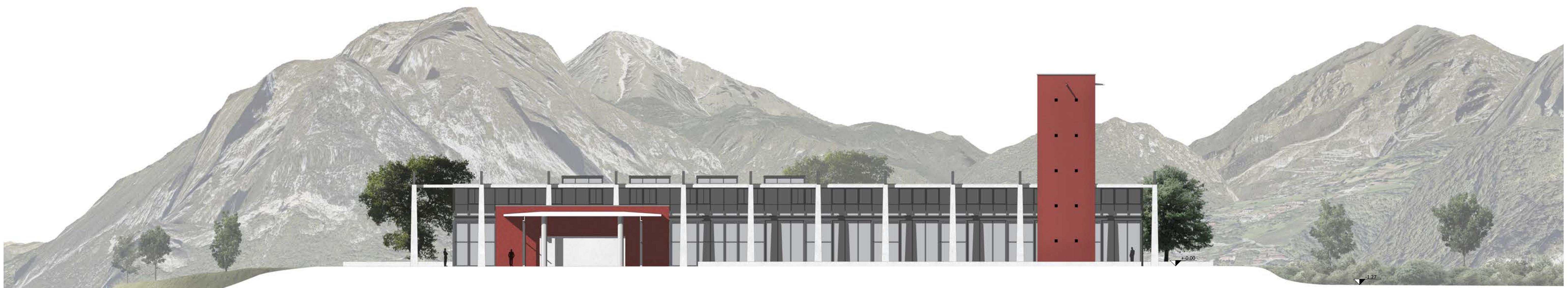
Profilo altimetrico trasversale