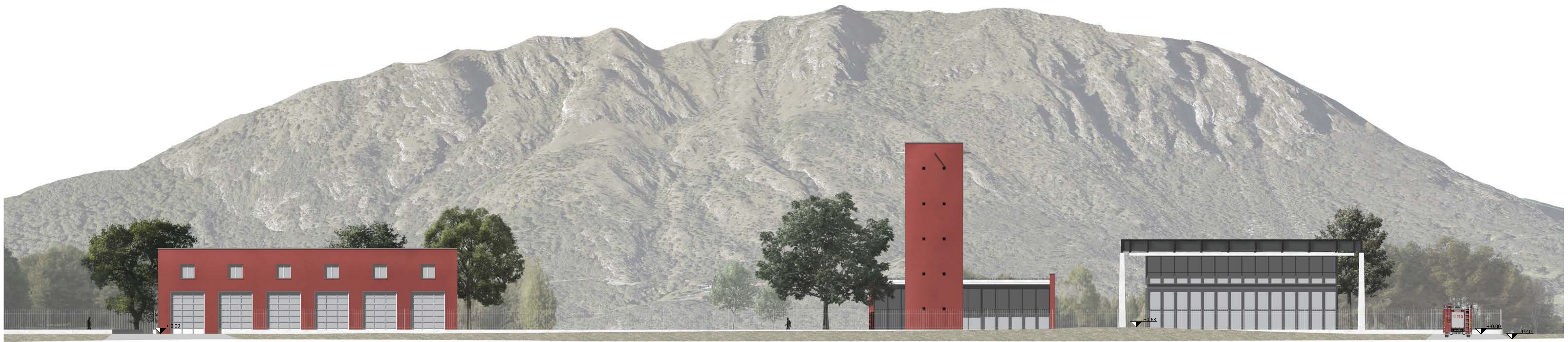
Profilo altimetrico sulla direttrice della viabilità principale